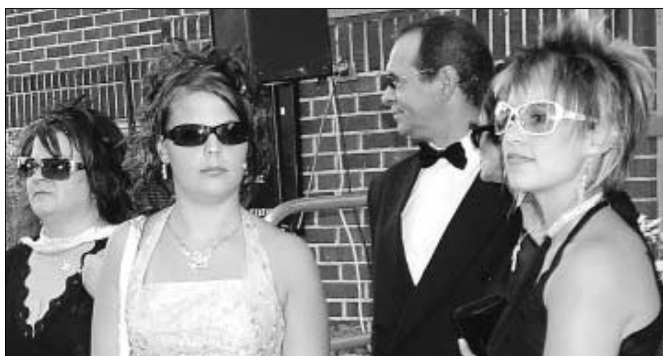
DEUX JEUNES INVITÉES qui ont fait fureur aux «Guy-Lou Awards».