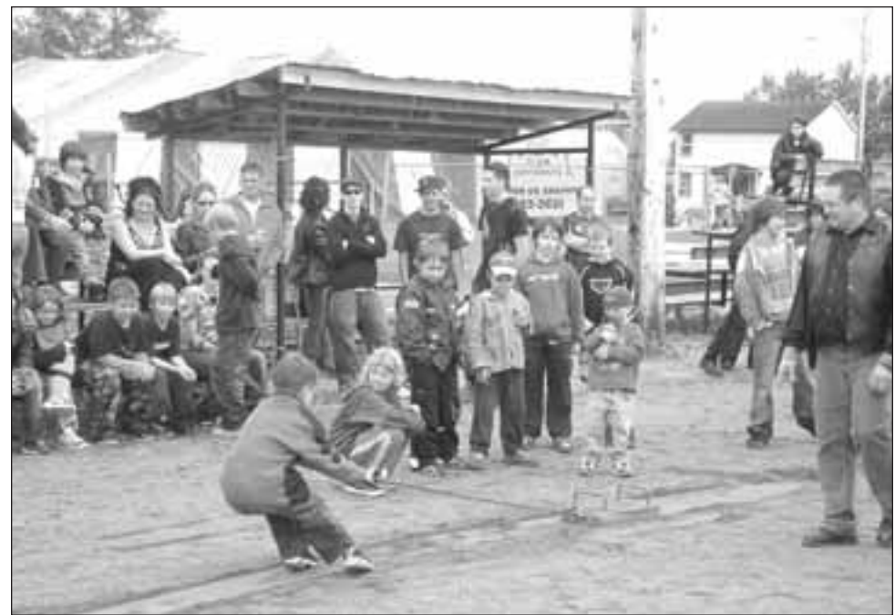
FIDÈLE À SON habitude, le festival offrait une foule de jeux, concours et activités pour tous les goûts. Ici, on tente de tirer un poids le plus rapidement possible d'un point à un autre. (Photos: Lisanne Côté)

Les tremplins et les glissoires sont prohibés autour des piscines hors terre. Souvenez-vous que la plupart des piscines de jardin ne sont pas suffisamment profondes pour pouvoir y plonger en toute sécurité. (L.C.)