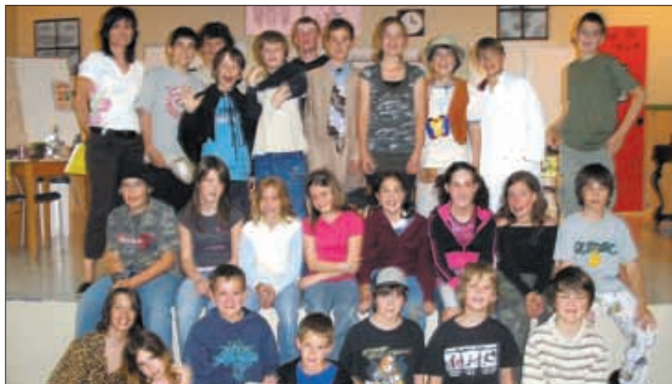
LES ÉLÈVES DES 5e et 6e années de l'école primaire Bon-Conseil étaient très enthousiastes de démontrer leur connaissance de l'anglais devant public.

Comme la fin des classes a sonné, j'en profite pour dire à tous les étudiants: Good Holiday and take care!(L.C.)