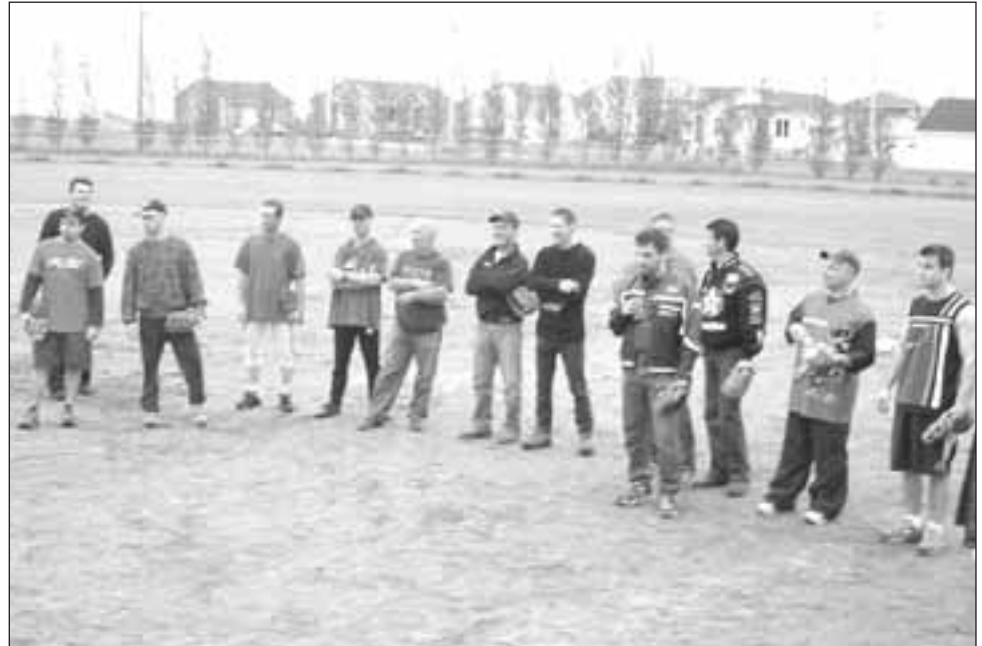
LA MASCOTTE TI-MÉ se fait bien discrète derrière la ribambelle de tout petits. Maquillage pour enfants ou concours de peinture, les activités ne manquaient pas pour les amuser et les divertir