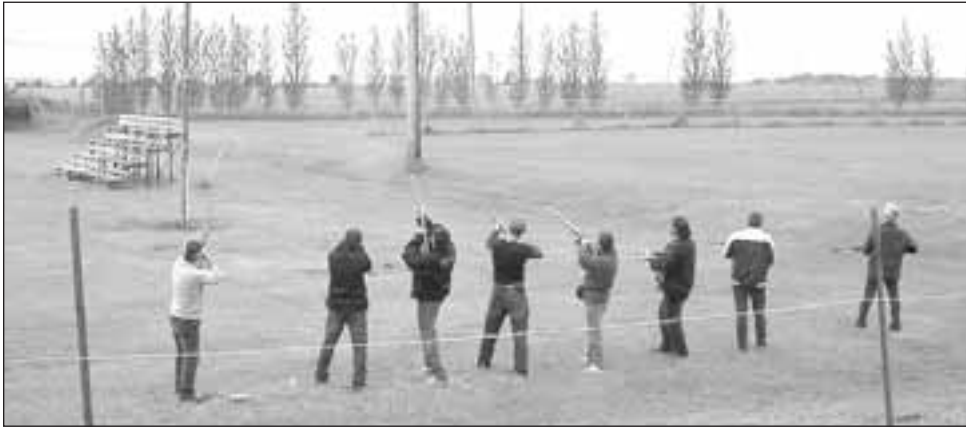
LA TRADITION SE poursuit avec l'Hommage aux Seigneurs. Comme à chaque année, le tir sur le mai a attiré bien des curieux. À noter que les seigneurs ont procédé à la plantation d'un autre arbre afin de démontrer l'importance de l'environnement et le respect qu'on lui porte

bénévoles, partenaires (la municipalité, le Club Éperlan, L'AFÉAS, L'Âge d'or, le comité des loisirs, SPECTRAL, les pompiers) et commanditaires. Il adresse également un immense merci aux jeunes pour leur implication et à toutes les personnes qui étaient présentes pour cette 36 e édition.