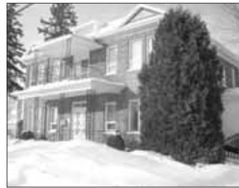
LE PRESBYTÈRE D'HÉBERTVILLE-STATION est devenu un Centre d'accueil privé destiné aux personnes âgées en 1985.

Également, un ascenseur est mis à la disposition des pensionnaires, permettant ainsi l'accès au sous-sol, où la chapelle se trouve.