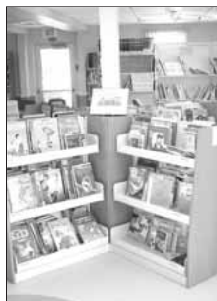
EN ÉTANT AFFILIÉE au Réseau BIBLIO du Saguenay-Lac-Saint-Jean, la bibliothèque peut offrir plusieurs avantages.

L'entente avec le Service d'aide à la rénovation patrimoniale (SARP) a été renouvelé pour 2006, au coût de 245 $. Le projet de la Société d'histoire du Lac-Saint-Jean vise à aider les gens à rénover leur maison, tout en conservant le cachet. Cette année, deux dossiers pourront être traités. Les critères d'admissibilité sont l'âge de la maison (25 ans et plus) et la section d'intervention (municipalité d'Hébertville-Station). Le projet ne s'adresse que pour les maisons.(L.C.)