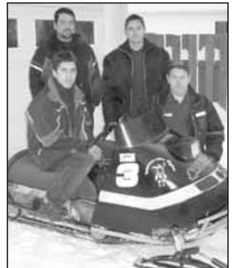
L'ÉQUIPE COMPOSÉE D'EVANS et Marc (derrière), Nicol et Pascal (devant), résidents tous à Hébertville-Station, a bien hâte de courir lors des Gaietés hivernales.

Les quatre jeunes hommes consacrent littéralement leur hiver à assembler, réparer et préparer leurs «minoues». Ils s'entendent d'ailleurs pour dire que les courses représentent un loisir à part entière. Tellement