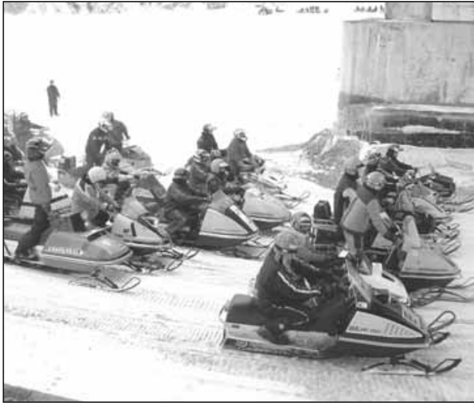
DES BOLIDES EN attente du coup de départ.